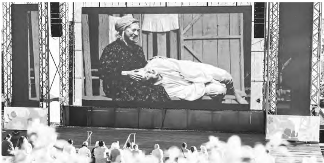
Куряне смотрят «Женитьбу Бальзаминона» на Полугоре