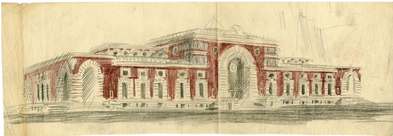
Проект. 1945–1947 годы. Фасад со стороны города. Перспектива. Эскиз. Бумага, карандаш, цветной карандаш

связанное как с привокзальной площадью, так и с пандусами, ведущими в тоннели к платформам, а также с кассами, багажными помещениями и прочими.