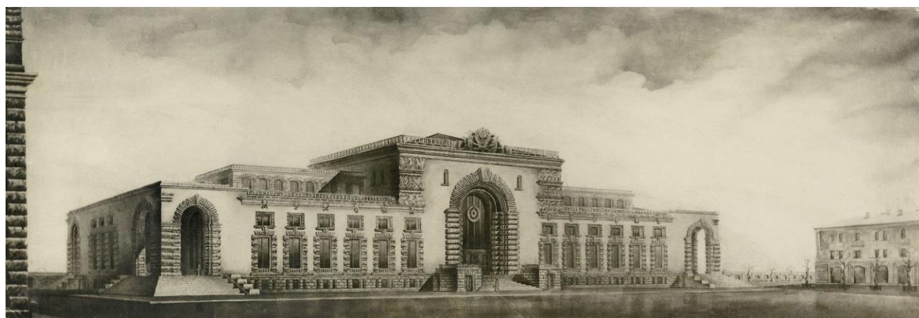
Технический проект. 1945–1946 годы. Фасад со стороны города Перспектива. Фотокопия с оригинала.

В Курском вокзале сразу обращает на себя внимание главный вход, оформленный в виде грандиозной, на весь фасад, арки-портала. В истории вокзал строения этот приём имеет солидную родословную и неизменно является одним из знаков железнодорожного вокзала.