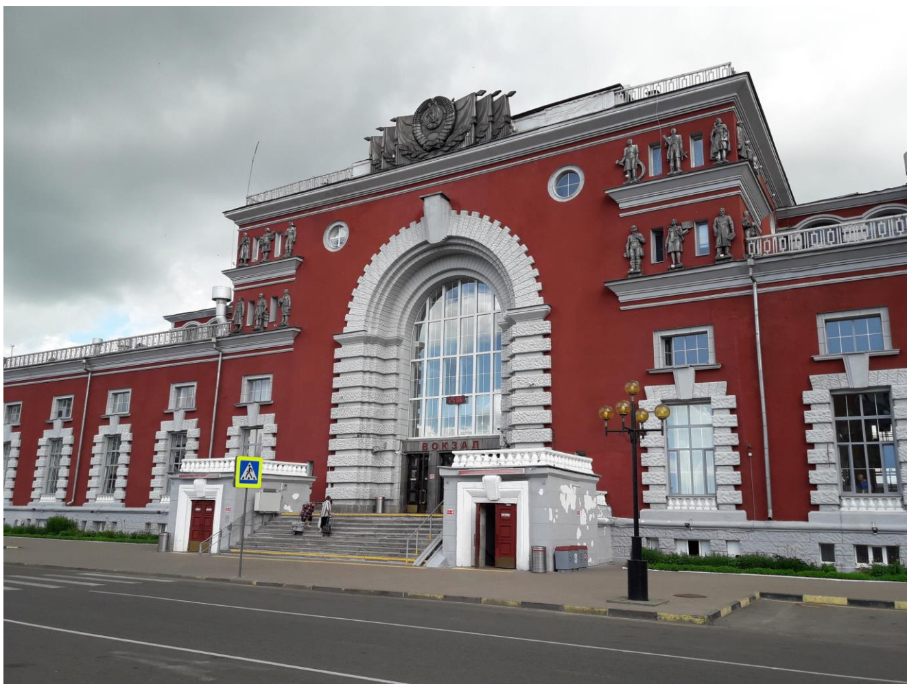
Фрагмент главного фасада вокзала станции Курск

Здание Курского вокзала решено в простых монументальных формах на основе творческой переработки архитектуры русского классицизма.