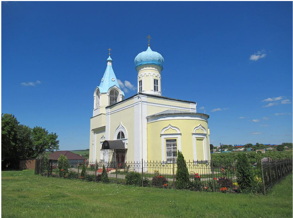
«Церковь Митрофановская», вид с юго-востока, июль 2022 года (фотография из проектной документации)

Вокруг храма кованое ограждение с воротами, выкрашенное в чёрный цвет.