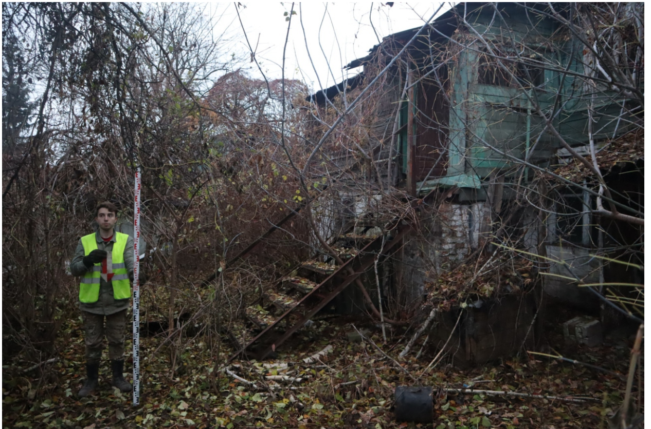
Рис. 18. Археологическая разведка в г. Курск Курской области. 2024 г. Точка фотофиксации 3. Вид с С.