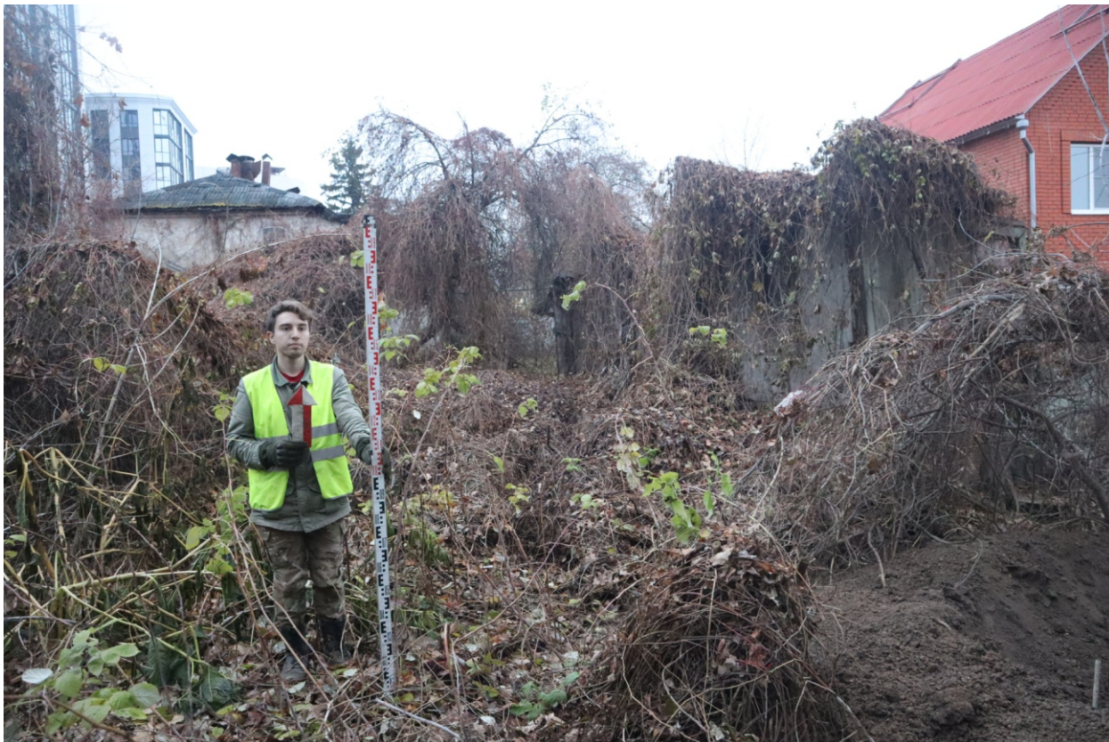
Рис. 10. Археологическая разведка в г. Курск Курской области. 2024 г. Точка фотофиксации 1. Вид с Ю.