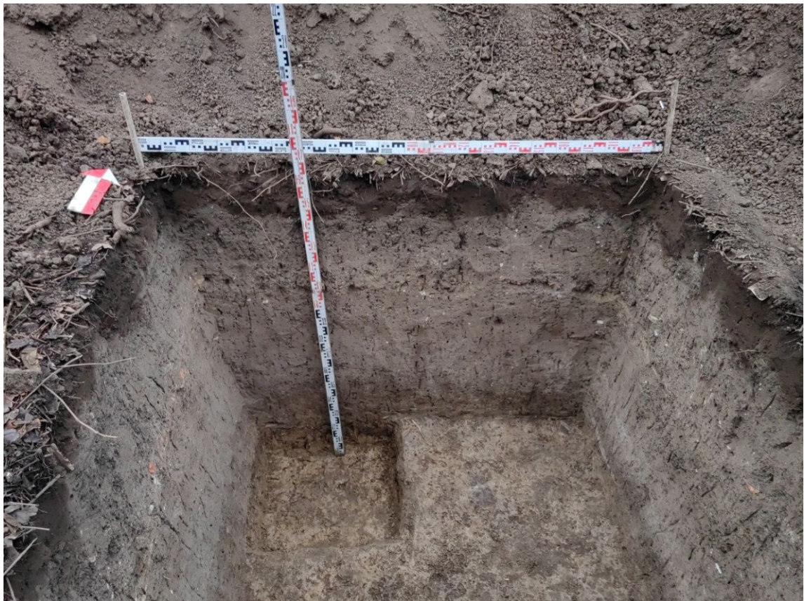
Рис. 27. Археологическая разведка в г. Курск Курской области. 2024 г. Шурф 1. Северный борт (контрольный прокоп). Вид с Ю.