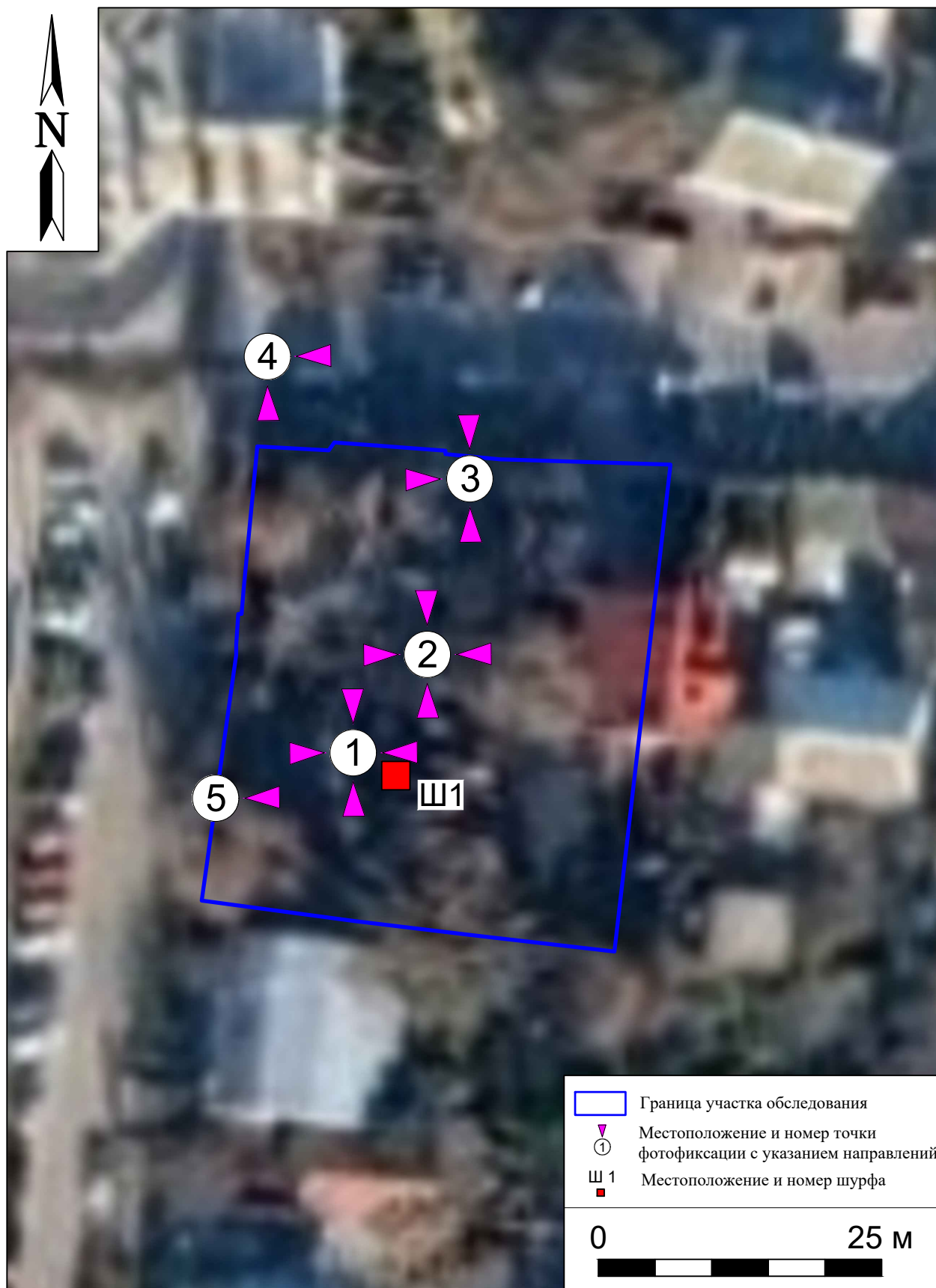
Рис. 9. Археологическая разведка в г. Курск Курской области. 2024 г. Ситуационный план участка обследования с указанием местоположения шурфа, точек фотофиксации и их направлений на космоснимке 2023 г.