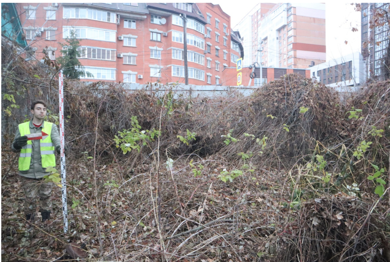
Рис. 11. Археологическая разведка в г. Курск Курской области. 2024 г. Точка фотофиксации 1. Вид с В.