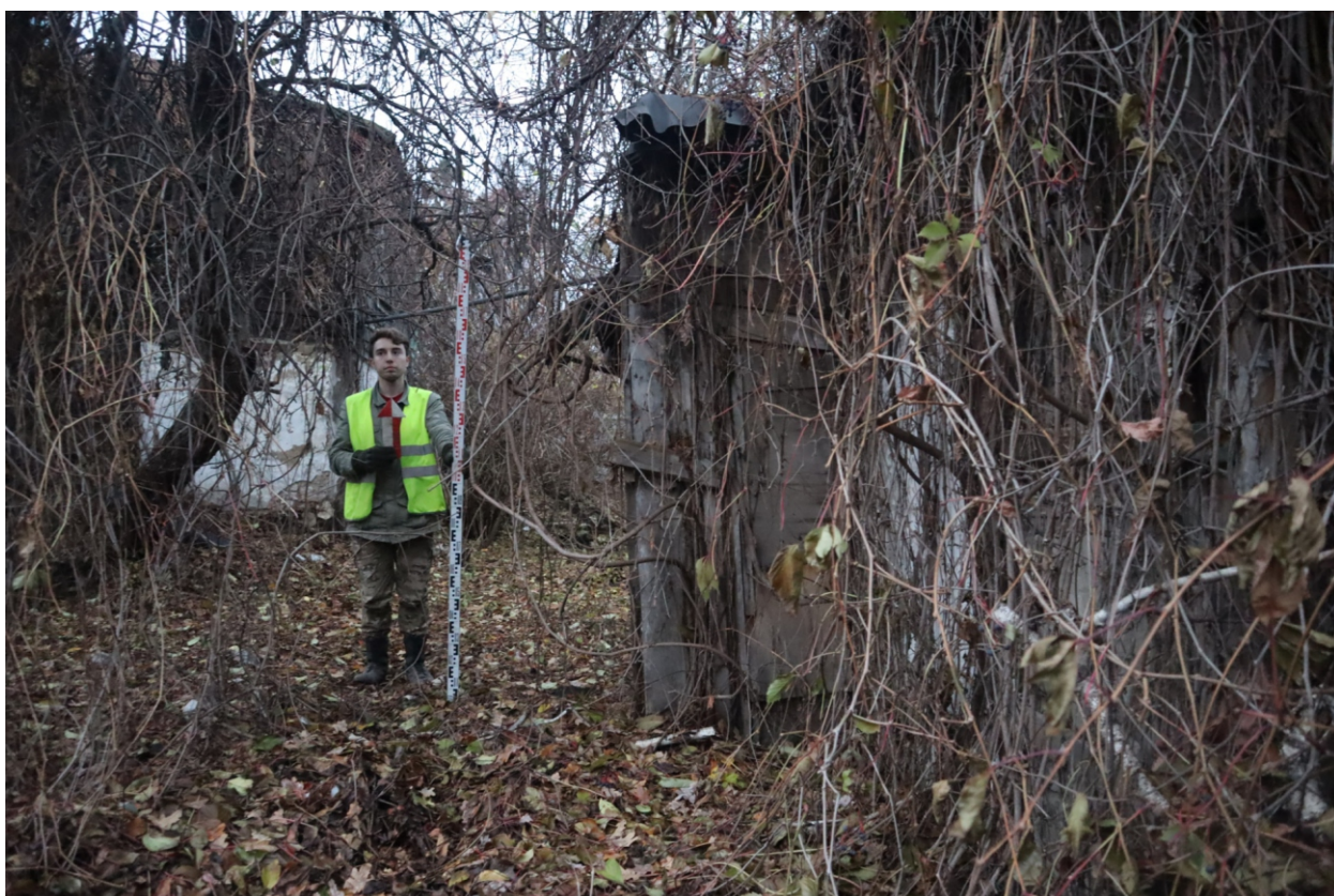
Рис. 17. Археологическая разведка в г. Курск Курской области. 2024 г. Точка фотофиксации 2. Вид с Ю.