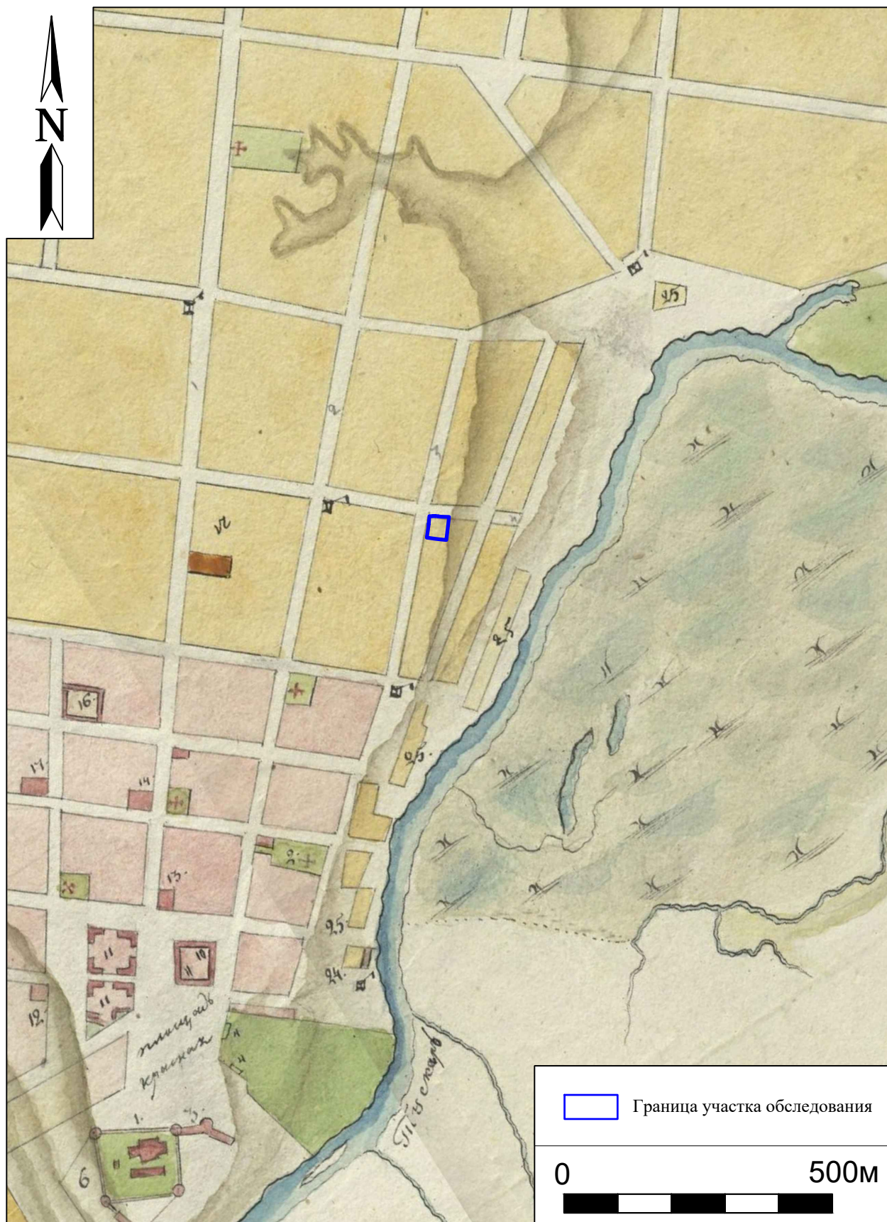
Рис. 6. Археологическая разведка в г. Курск Курской области. 2024 г. Участок обследования на плане губернского города Курска 1836 г.