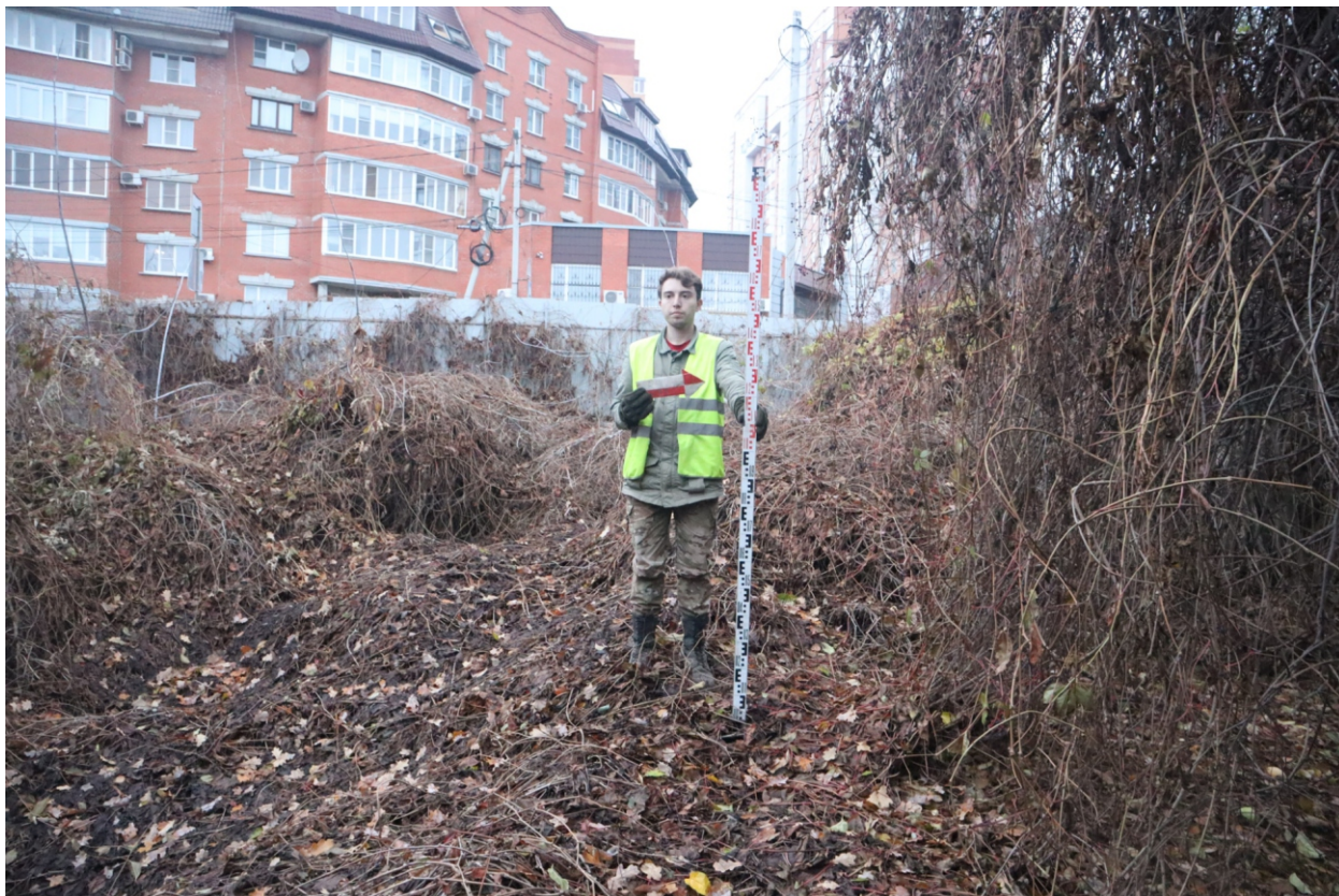
Рис. 14. Археологическая разведка в г. Курск Курской области. 2024 г. Точка фотофиксации 2. Вид с В.