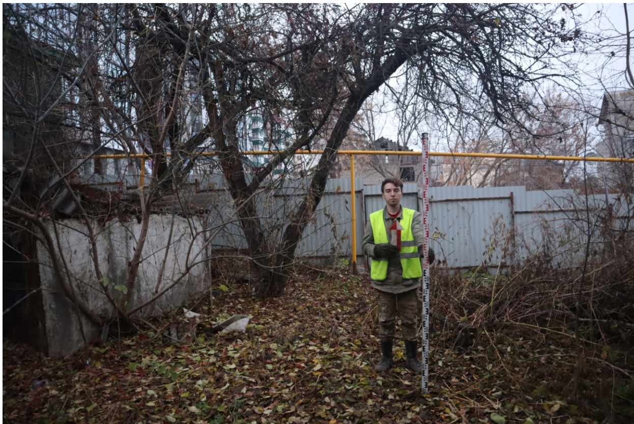
Рис. 20. Археологическая разведка в г. Курск Курской области. 2024 г. Точка фотофиксации 3. Вид с Ю.