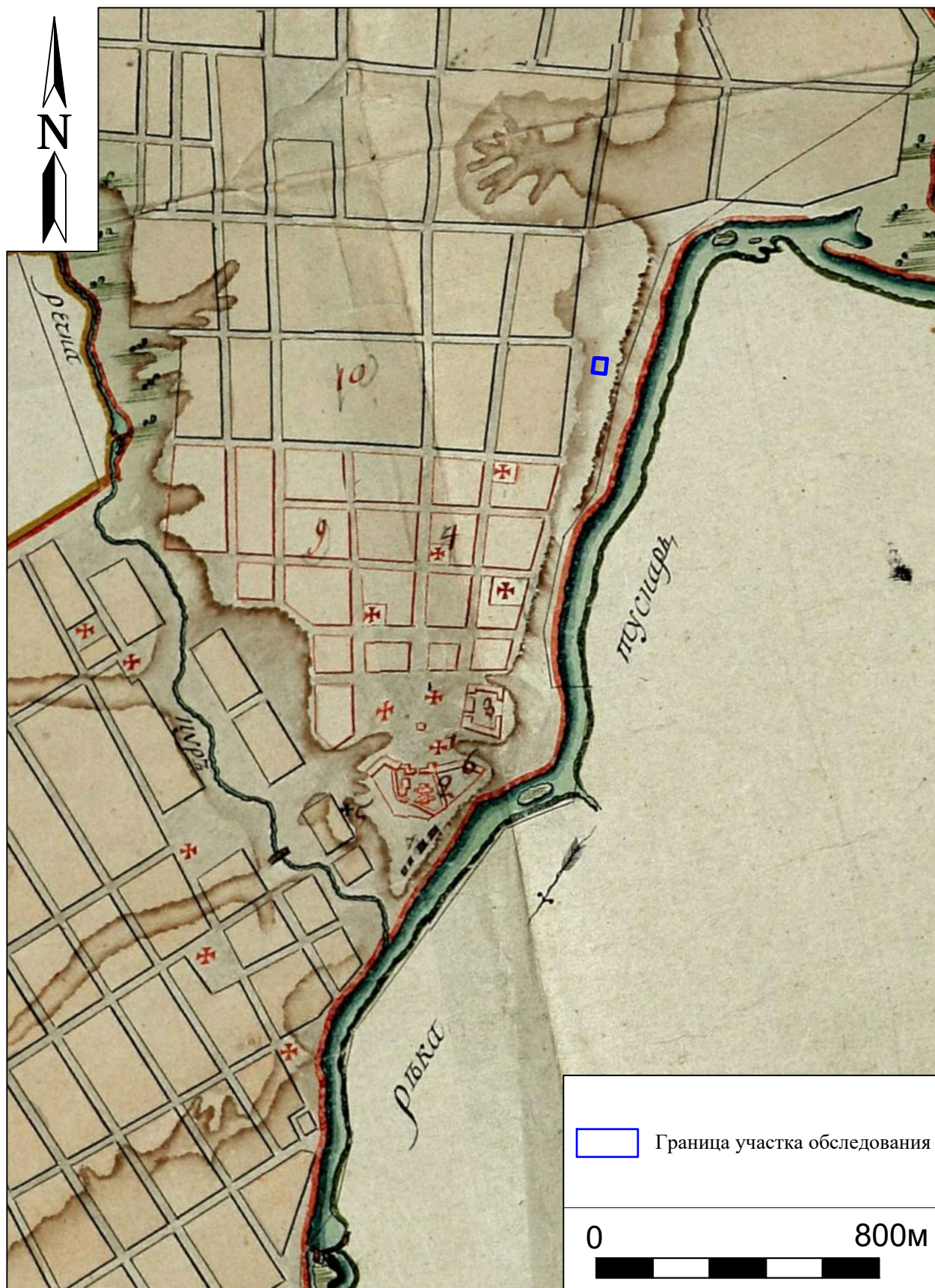
Рис. 5. Археологическая разведка в г. Курск Курской области. 2024 г. Участок обследования на Плане города Курска 1782 г.