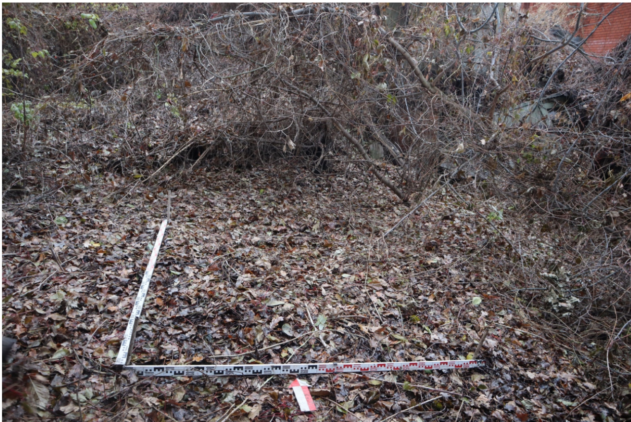
Рис. 24. Археологическая разведка в г. Курск Курской области. 2024 г. Шурф 1. Общий вид с Ю до начала работ.