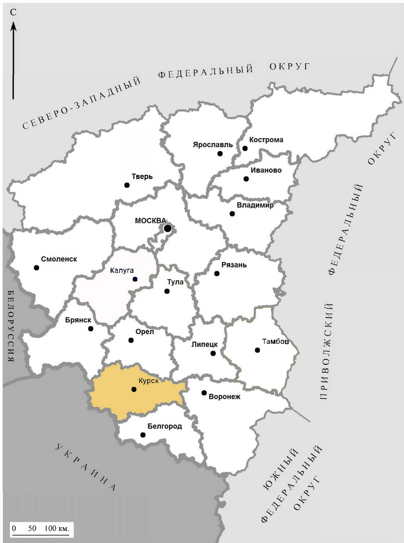
Рис. 1. Археологическая разведка в г. Курск Курской области. 2024 г. Карта Центрального федерального округа с выделенной Курской областью.