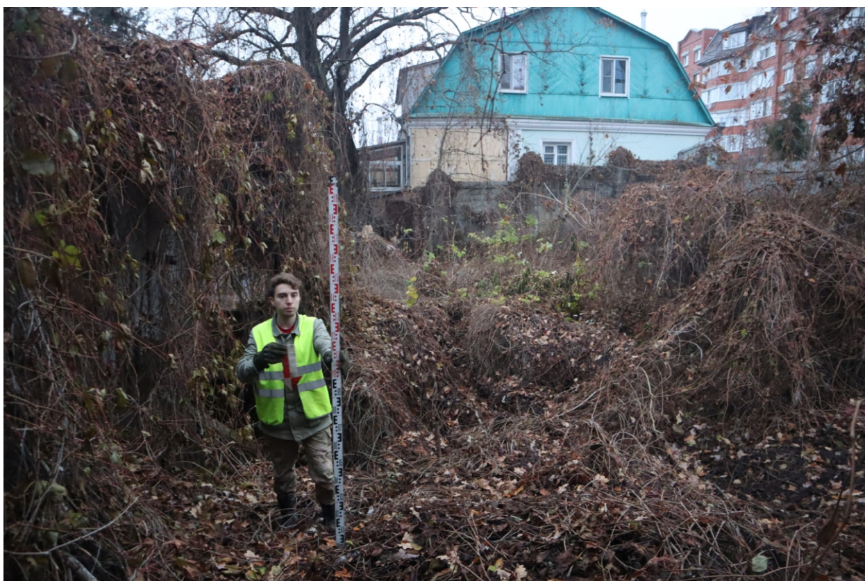
Рис. 15. Археологическая разведка в г. Курск Курской области. 2024 г. Точка фотофиксации 2. Вид с С.