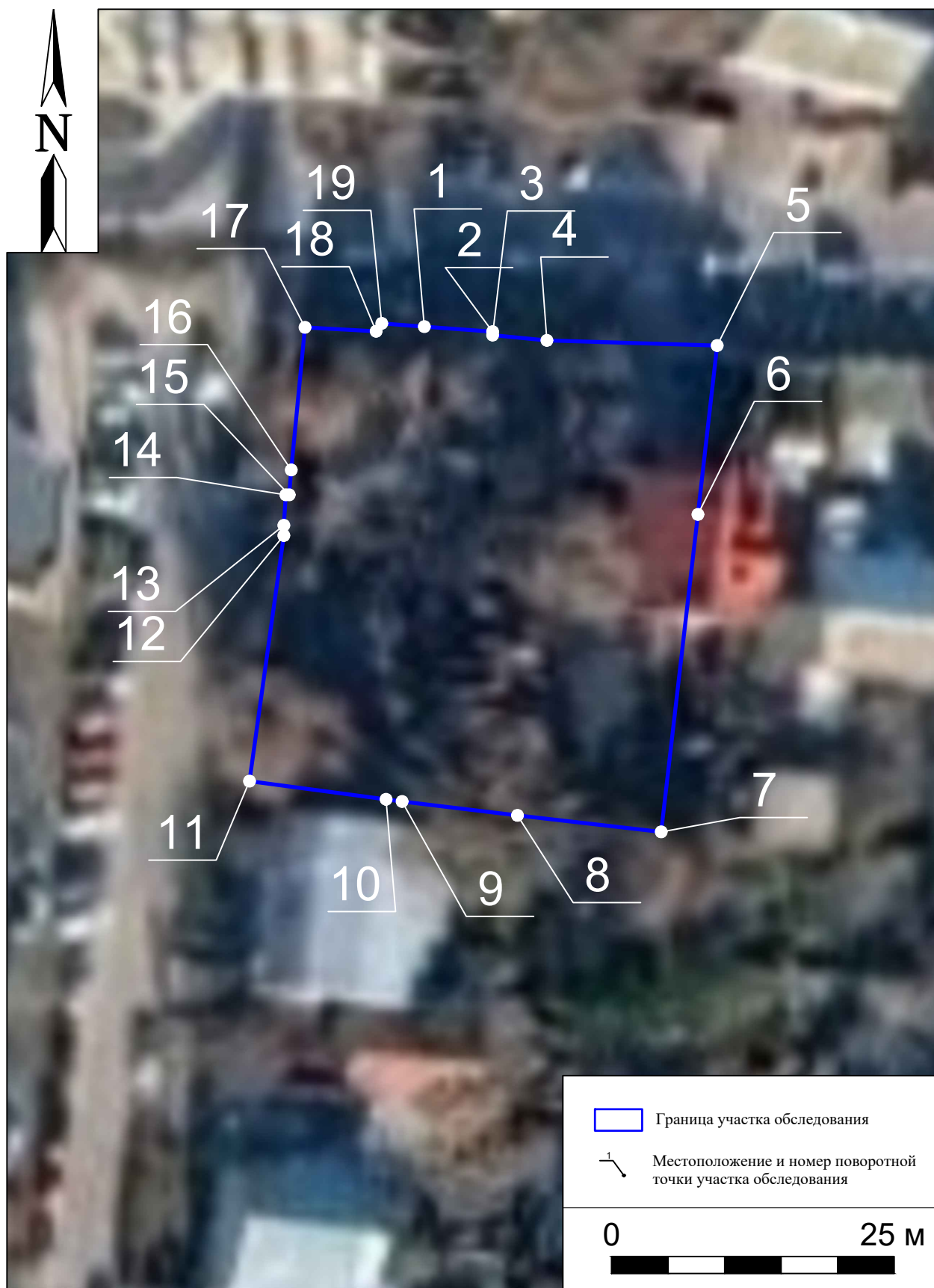
Рис. 8. Археологическая разведка в г. Курск Курской области. 2024 г. Ситуационный план участка обследования с указанием поворотных точек на космоснимке 2023 г.