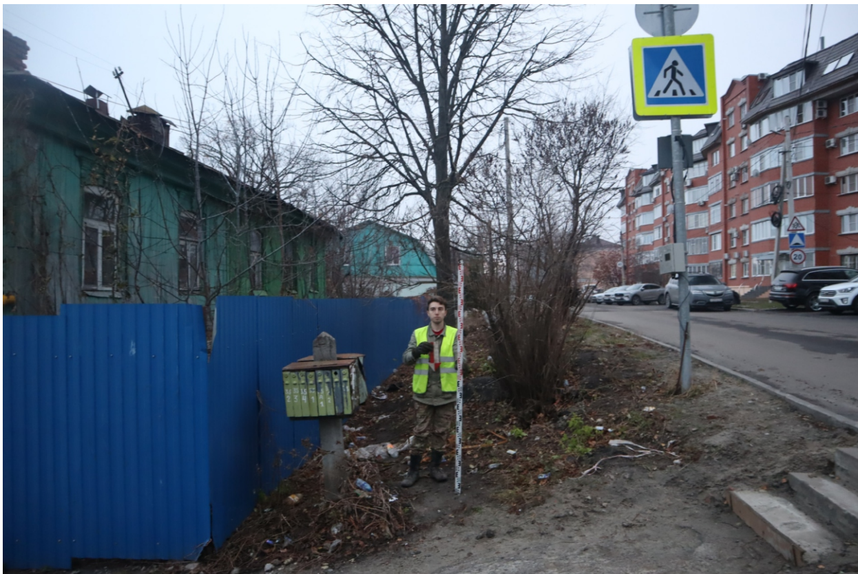
Рис. 22. Археологическая разведка в г. Курск Курской области. 2024 г. Точка фотофиксации 4. Вид с С.