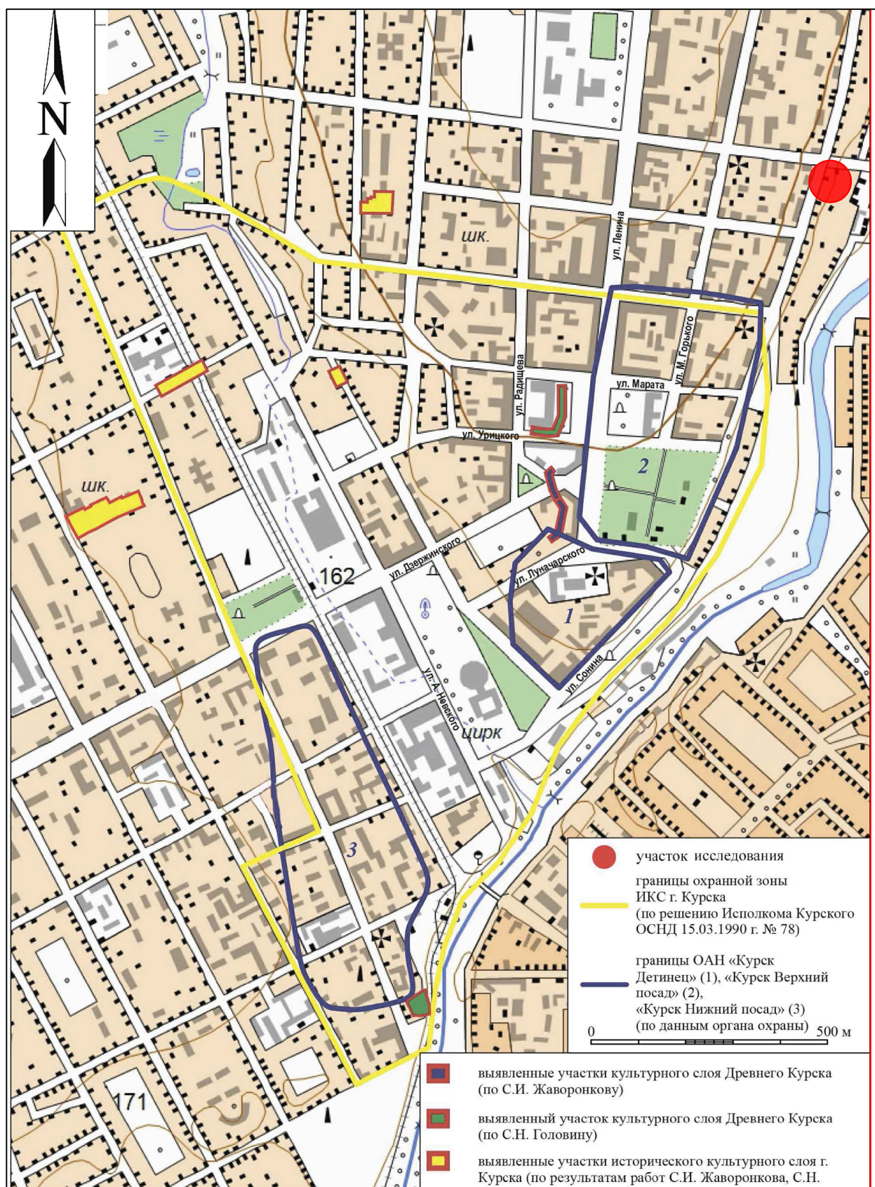
Рис. 4. Археологическая разведка в г. Курск Курской области. 2024 г. Ситуационный план памятников археологии г. Курска с указанием участка обследования.