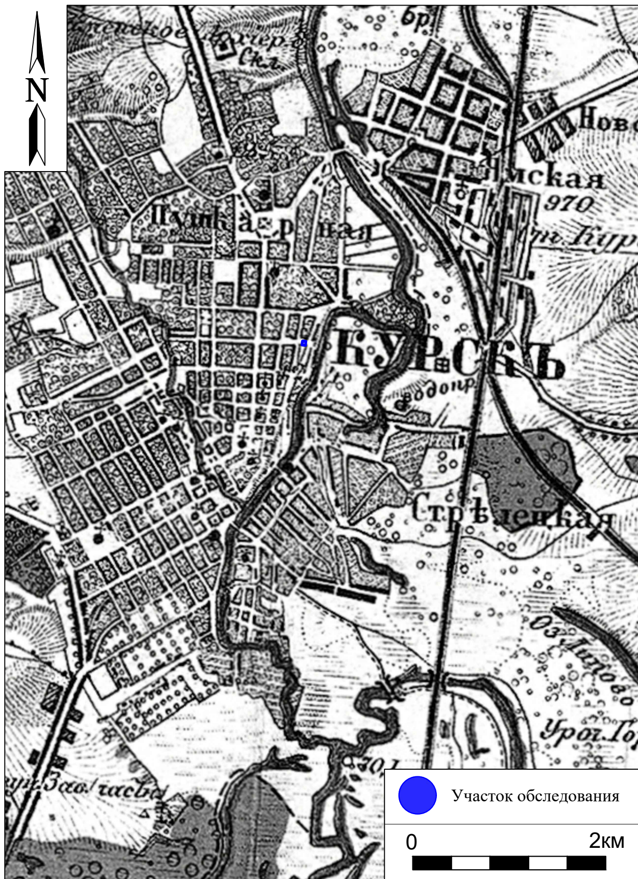
Рис. 7. Археологическая разведка в г. Курск Курской области. 2024 г. Участок обследования на трёхверстовой карте Шуберта Курской области 1870 г.