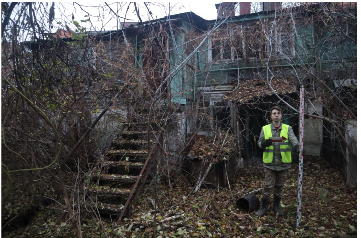
Рис. 19. Археологическая разведка в г. Курск Курской области. 2024 г. Точка фотофиксации 3. Вид с З.