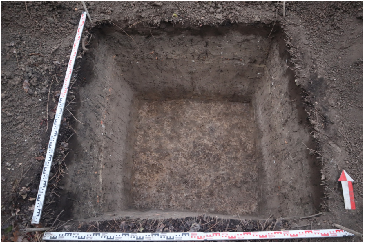
Рис. 26. Археологическая разведка в г. Курск Курской области. 2024 г. Шурф 1. Материк. Вид с Ю.