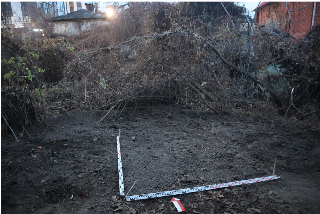
Рис. 28. Археологическая разведка в г. Курск Курской области. 2024 г. Шурф 1. Рекультивация. Вид с Ю.