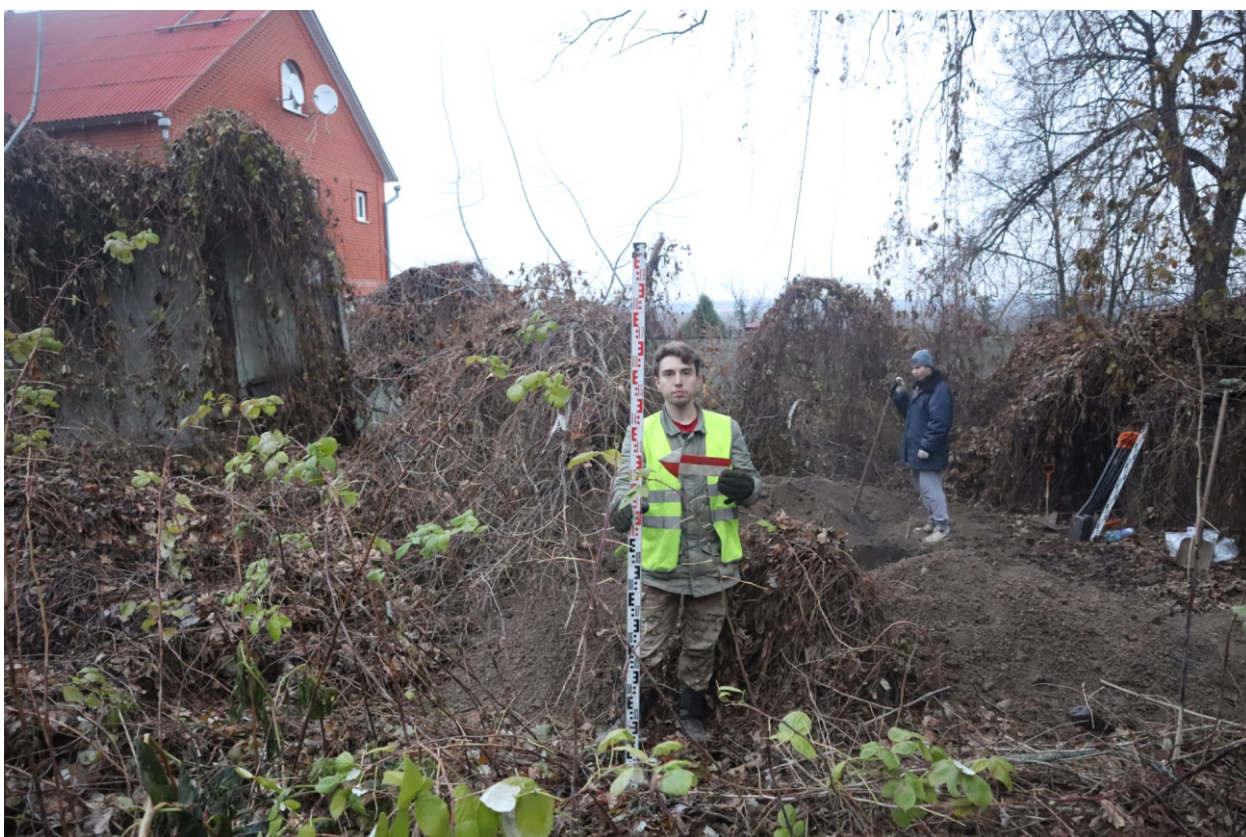
Рис. 13. Археологическая разведка в г. Курск Курской области. 2024 г. Точка фотофиксации 1. Вид с З.