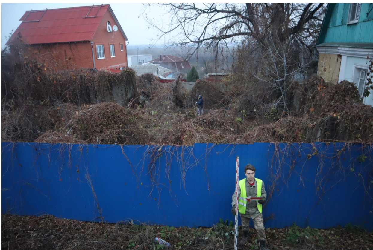
Рис. 23. Археологическая разведка в г. Курск Курской области. 2024 г. Точка фотофиксации 5. Вид с С.