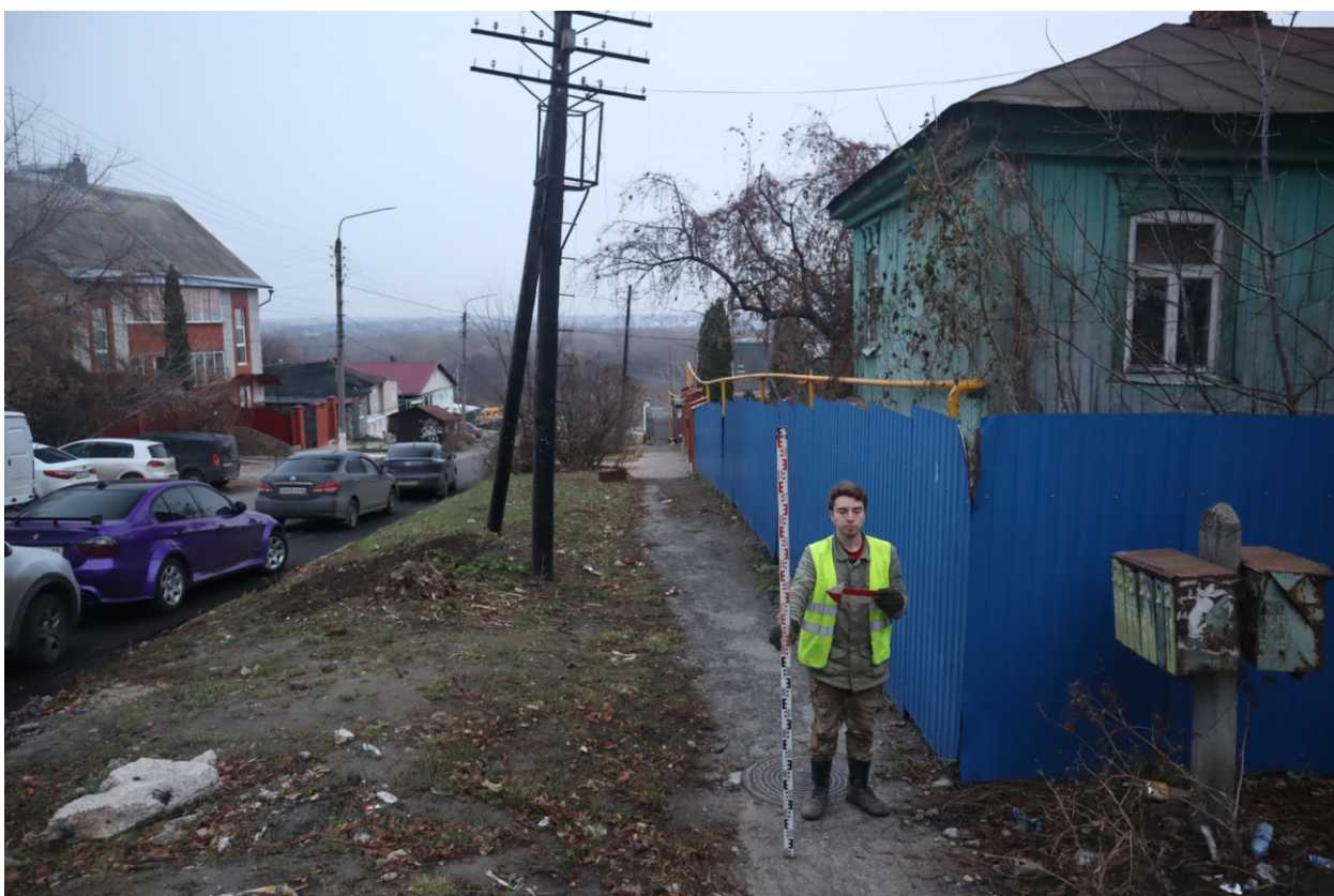
Рис. 21. Археологическая разведка в г. Курск Курской области. 2024 г. Точка фотофиксации 4. Вид с З.