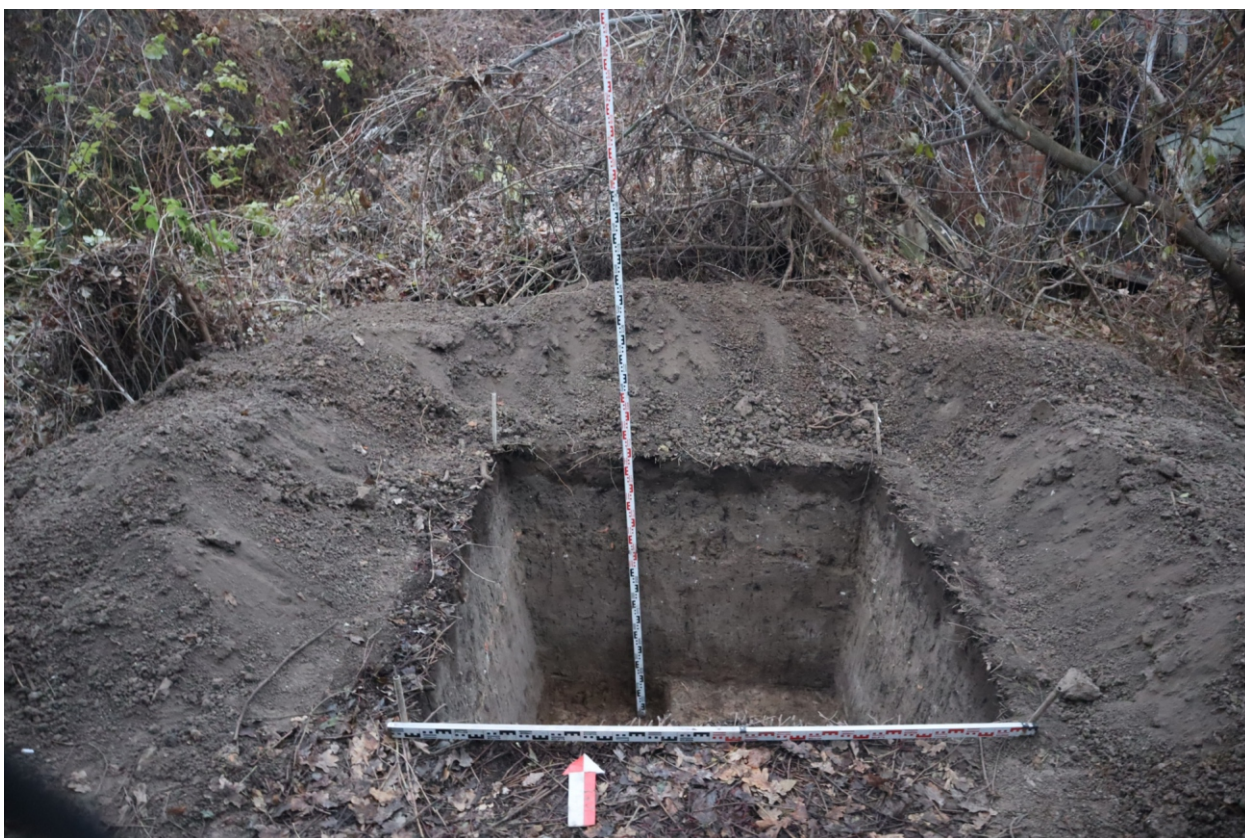
Рис. 25. Археологическая разведка в г. Курск Курской области. 2024 г. Шурф 1. Общий вид с Ю после окончания работ.