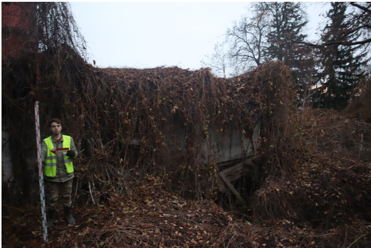
Рис. 16. Археологическая разведка в г. Курск Курской области. 2024 г. Точка фотофиксации 2. Вид с З.