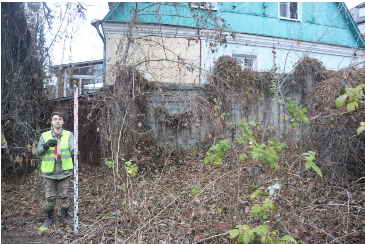
Рис. 12. Археологическая разведка в г. Курск Курской области. 2024 г. Точка фотофиксации 1. Вид с С.